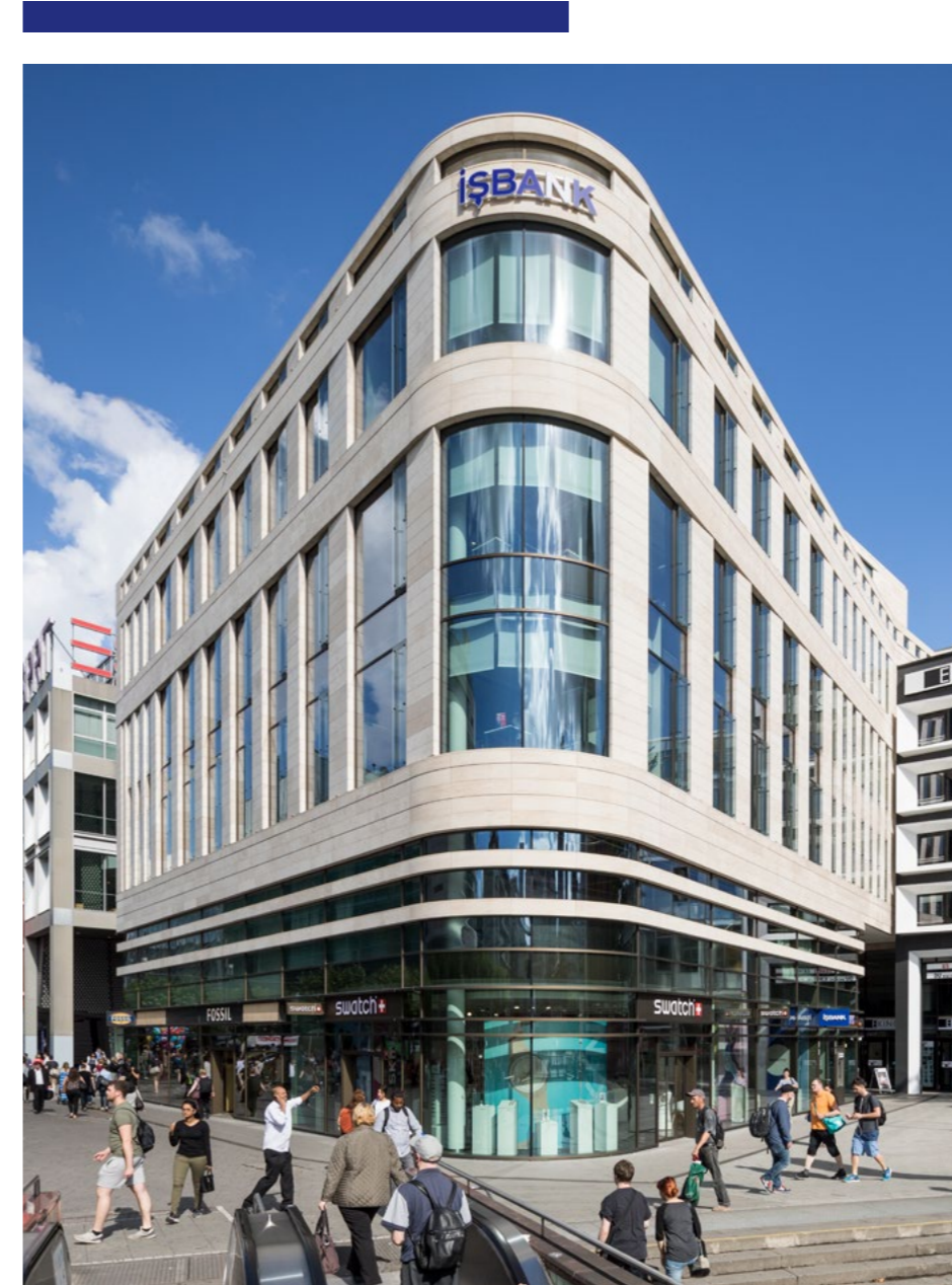
Zeil 123 Frankfurt am Main

As one of the founders of the international office location Eschborn, Gertler Estates also holds numerous other properties in the area as well as further land for development. Our office team would be delighted to hear from you.