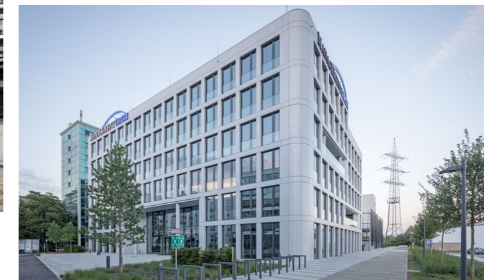
Düsseldorfer Straße 36 Eschborn