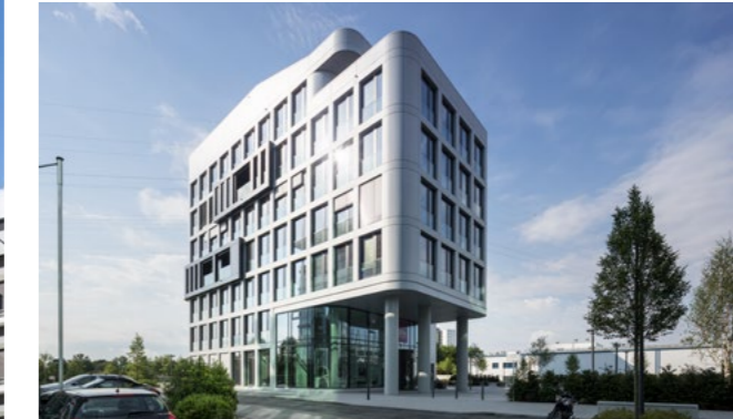
Düsseldorfer Straße 38 Eschborn